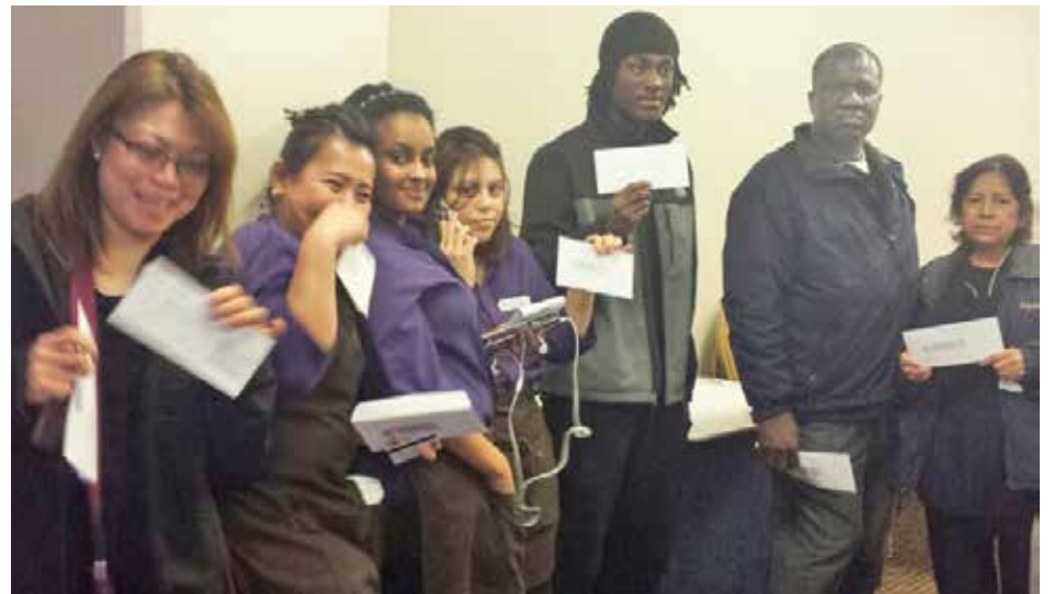
GAYLORD WORKERS SHARE $150,000 IN BACK PAY THEY WON.

Finally, however, the Union forced management to a settlement. They paid workers in seven different departments and in eight different classifications a total of $150,000. Management also hired additional full time, Union workers.